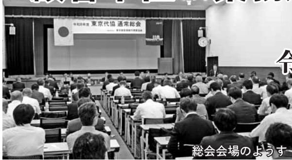
総会会場のようす

「東京代協は引き継ぎ、消費者や業界関係者をはじめとする多くの方々の意見を聞きながら、80年の歴史を土台として、皆さま