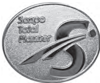
■トータルプランナー認定バッジ