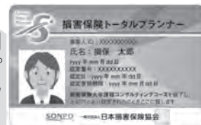
顔写真付き認定証イメージ

顔写真付き認定証・認定バッジを使用 できます。また「損害保険トータルプ ランナー」という称号と、シンボルマ ークを名刺等に使用できます。