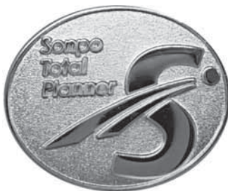
■トータルプランナー認定バッジ