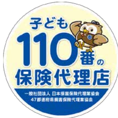
丸型ステッカー 直径246mm