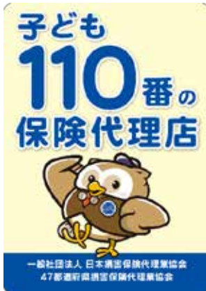
縦長ステッカー 横170mm 高さ240mm