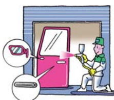
部品生産工場等で点検・清掃・美化、修理・部品の交換などを行います。